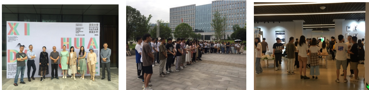
图 7、图 8、图 9、美丽乡村设计系列成果展

7. 策划举办展览。中心连续3年依托毕业设计，专门针对美丽乡村规划与设计、美丽乡村品牌塑造与视觉设计，农机外观设计等进行展览主题策划，展出了100余件设计作品，对乡村规划建设、乡村环境设计、乡产品形象传播、农机产品设计等新乡村生活需求进行挖掘，对产品、空间、视觉形象、技术、管理等方面进行积累