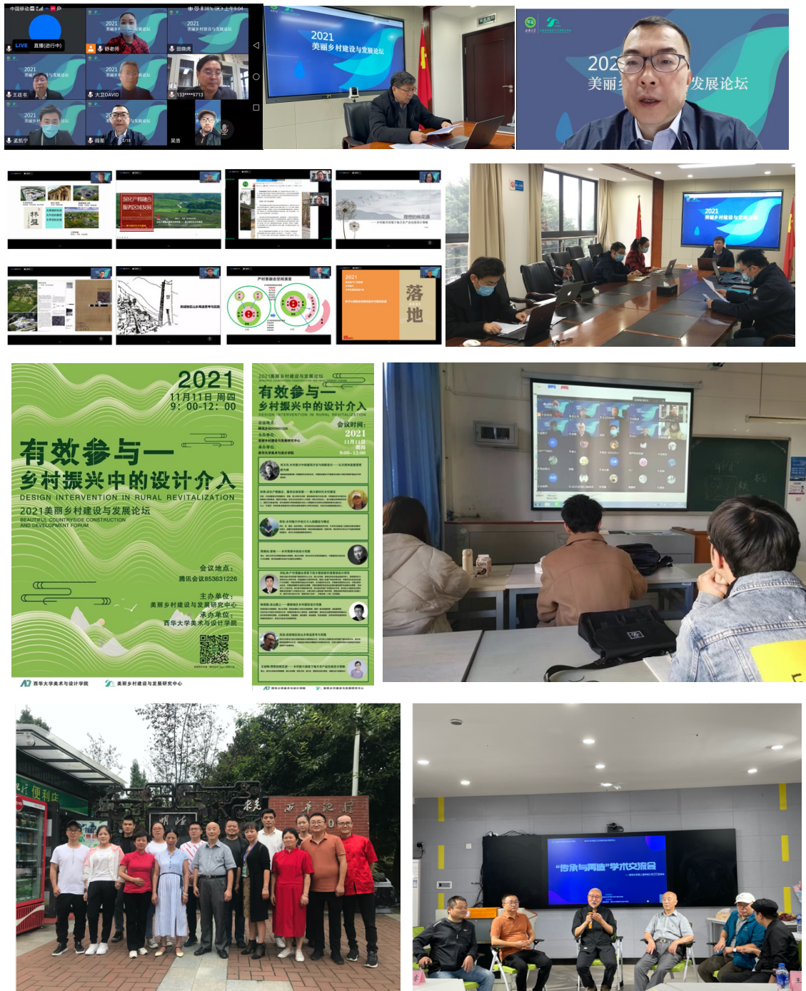
图 13-图 20 2021 年美丽乡村建设与发展论坛 图 21-图 22 流传与继承——传统工艺进西华校园学术活动