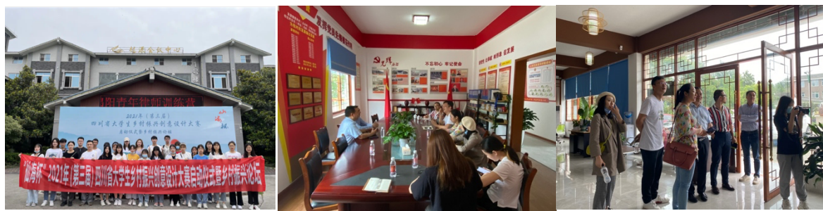
图 4、图 5、图 6、组织专家和师生团队外出进行乡村考察并与乡政府交流合作

6. 美丽乡村建设项目实践。近年，依托美丽乡村建设与发展研究基地、学校和中心专家组的资源，组织学校、老师参与多项美丽乡村建设发展相关实践项目。如美丽乡村墙绘项目、农产品品牌形象与包装设计、郫都区唐昌川西林盘规划设计、郫都区唐昌川西林盘导视系统设计、郫都区唐昌川西林盘院落空间改造设计、巴塘美丽乡村墙绘项目、巴塘乡村公共艺术设计等10余项乡村建设实践项目，切实为地方政府和企业提供关于美丽乡村建设与发展的智力支持。